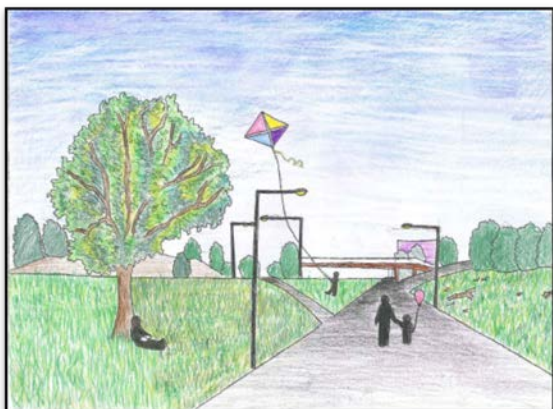
En elevs förslag på en trevlig gångmiljö